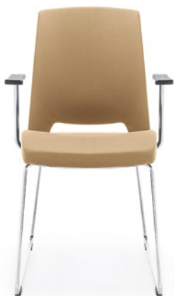
ARCA 21V CHROM PP