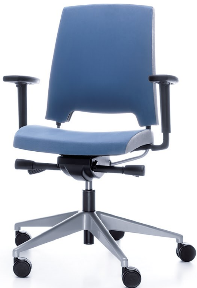
ARCA 21SL METALIK P54PU