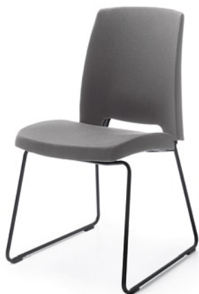
ARCA 21V CZARNY