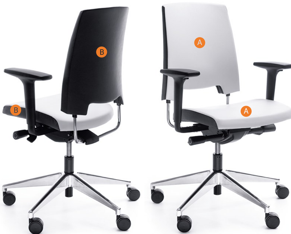
ARCA 21SL CHROM P51PU

Please clearly indicate in the order symbols of the upholstery colours, e.g. SL-28/SL-18 (where SL-28 - A, SL-18 - B).