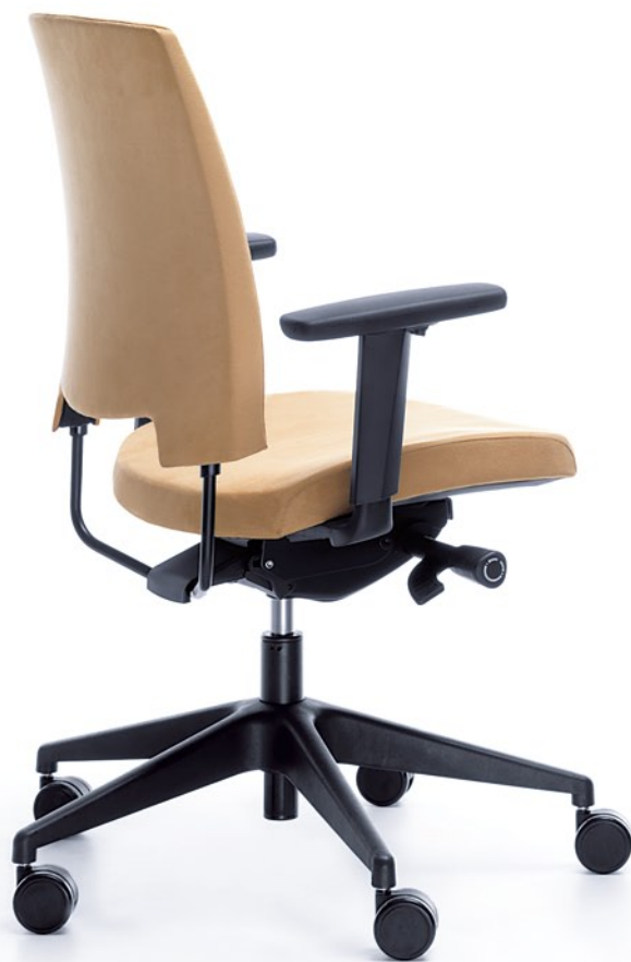
ARCA 21SL CZARNY P54PU