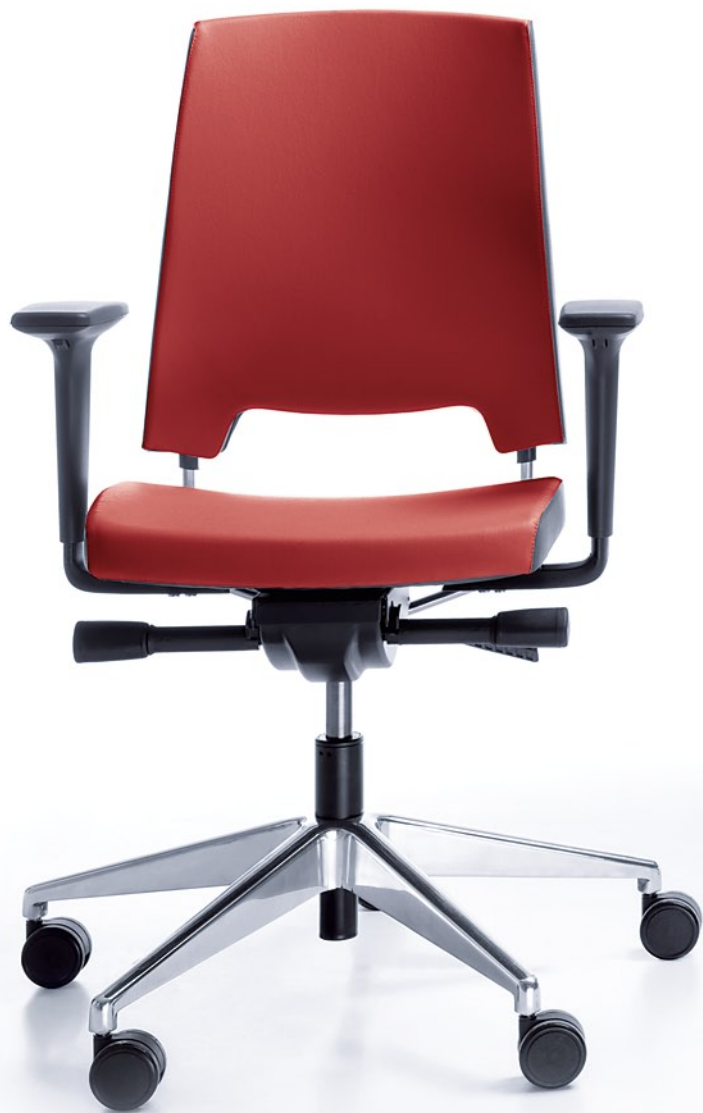
ARCA 21SL CHROM P51PU