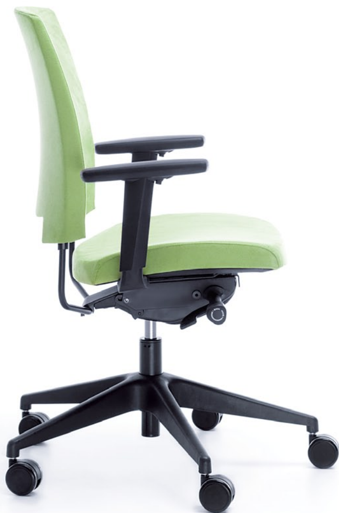
ARCA 21SL CZARNY P54PU